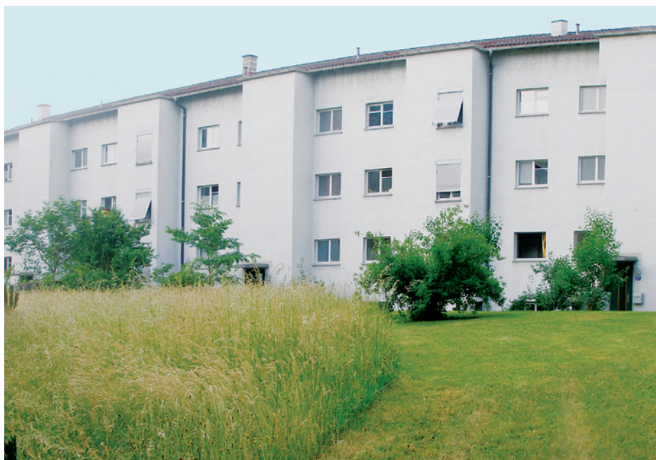
Abb. 12. Zur einfachen und kostengünstigen Erhöhung der Biodiversität können wenig genutzte Grünflächen seltener oder nur teilweise geschnitten werden. Rechts im Bild kann weiterhin gespielt werden, links kann sich eine höhere Biodiversität entwickeln, welche die Erlebniswelt der Anwohnerinnen und Anwohner bereichert und damit auch die Lebensqualität erhöht.