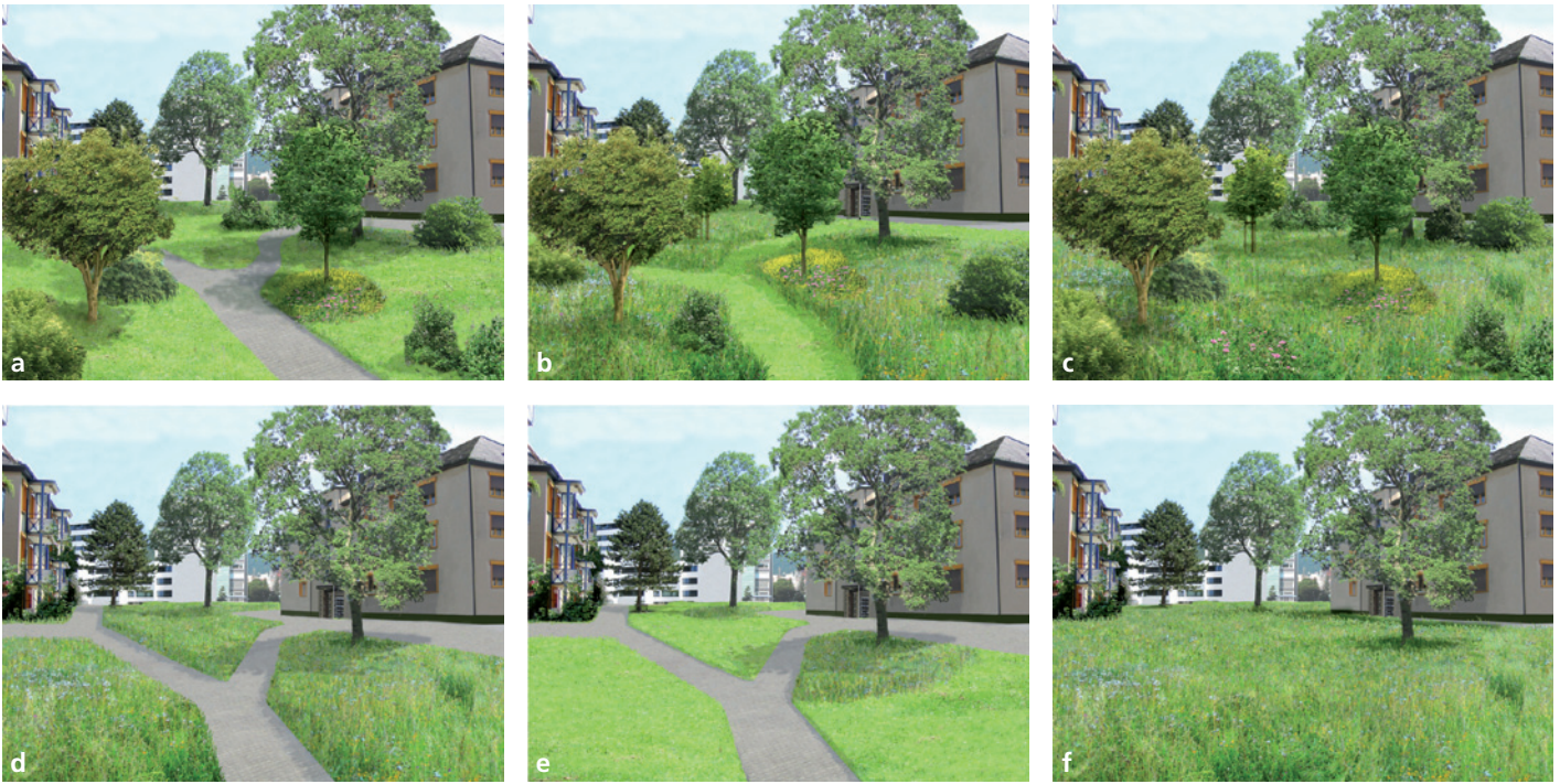
Abb. 7. Landschaftspräferenzen: Aus 12 Bildern wählten über 60 % der Leute bevorzugt die Landschaften in der oberen Bildreihe: 21,5 % (a), 20,2 % (b) und 19,8 % (c). Am wenigsten geschätzt waren die Landschaften in der Reihe unten (d, e, f): 0,7 %, 1,2 %, und 1,9 % (aus HOME 2009).

sehen und Möglichkeiten für verschiedene Nutzungen anbieten, zum Beispiel Wege, Bänke und Spielmöglichkeiten. Neben Vielfalt und Nützlichkeit ist für die Städterinnen und Städter die Zugänglichkeit und schnelle Erreichbarkeit der Grünanlagen wichtig. Dabei reicht vielen von ihnen bereits das Wissen, dass Grünräume vorhanden sind, die sie betreten könnten – auch wenn sie diese nicht eigentlich nutzen. Überdies ist den Leuten wichtig, dass Grünräume keine physischen oder sozialen Zugangsbarrieren haben. Zum Wunsch nach Zugänglichkeit gehört also auch das Bedürfnis nach persönlicher Sicherheit: man will sich in den Grünanlagen sicher fühlen.