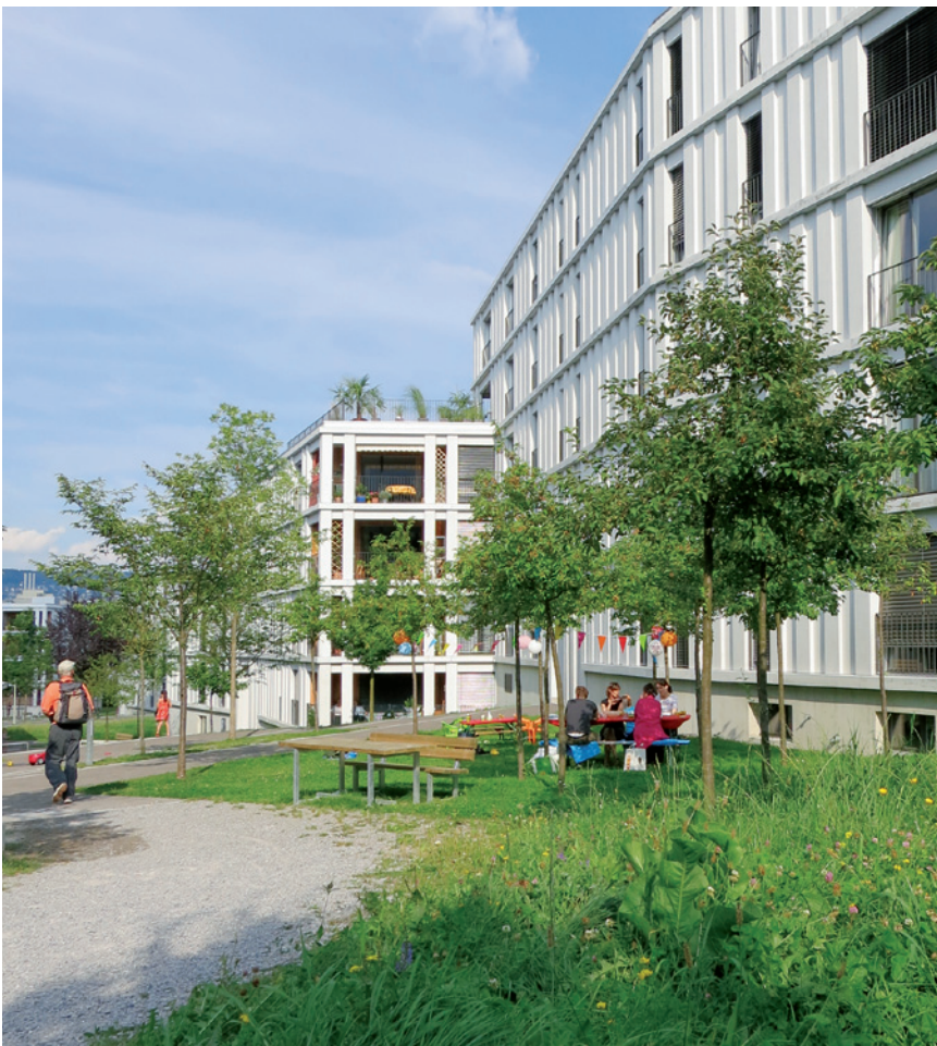
Abb. 1. Feierabendidylle an der Wasserschöpfli, Friesenberg, Zürich.