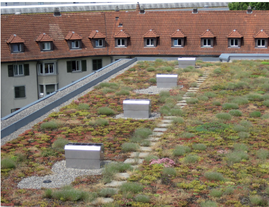
Abb. 11. Begrünte Flachdächer bieten viel Potential für Flora und Fauna.

aus Sicht der Stadtbevölkerung bestehen, können Grünraumplaner Versiegelungsgrad, mosaikartige Vielfalt von Strukturen und Lebensraumelementen oder die Anzahl Bäume – neben praktischen und gestalterischen Kriterien – erfolgversprechend in ihre Arbeit einbeziehen.