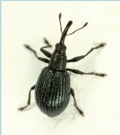
Abb. 10. Zwei Tierarten, mit denen sich unterschiedlich gut Werbung für Naturschutz machen lässt: Der attraktive Buntspecht ( Dendrocopos major , links) und unscheinbare Spitzmausrüsselkäfer ( Ischnopterapion virens , rechts).