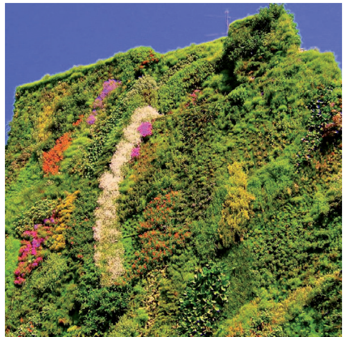
Abb. 13. Vertikale Gärten von Patrick Blanc: Innovative Formen von Grünflächen in verdichteten Baugebieten.