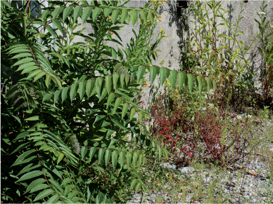
Abb. 4. Götterbaum ( Ailanthus altissima ), Einjähriges Berufkraut ( Erigeron annuus ), Nachtkerze ( Oenothera biennis agg.) und weitere Neophyten aus Ostasien und Nordamerika auf einer Ruderalfläche in Baden (AG).