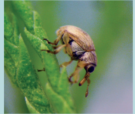
Abb. 6. Wiederfunde nach Jahrzehnten: Die Spinne Icius subinermis und der Rüsselkäfer Hypophyes pallidulus .

orten bei (SATTLER et al. 2010a). Nicht unerwartet steigt die Artenzahl mit zunehmendem Grünanteil und der weniger häufigen Pflege der Grünräume an. Sie sinkt umgekehrt mit zunehmender Versiegelung und intensiverer Pflege des Stadtgrüns, wobei häufige Rasenschnitte vor allem die Anzahl der weniger mobilen Arten reduzieren. Vögel kommen häufiger vor, wenn Lebensräume durch unterschiedliche Bäume und Büsche strukturiert sind. Sowohl für Wirbellose als auch für Vögel ist also das für städtische Landschaften so typische, kleinräumige Mosaik von Lebensräumen von grosser Bedeutung (SATTLER et al. 2010b).