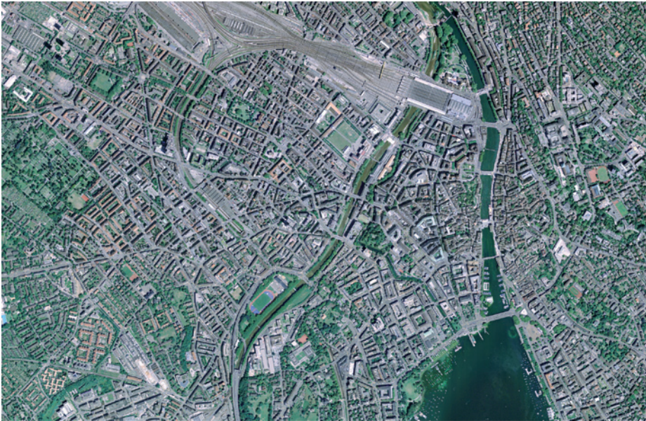
Abb. 2. Luftbild der Stadt Zürich.

Temperatur-Regulation bei, und sie gestalten und verschönern das Stadtbild. Ihre Überreste werden von einer Vielfalt von Organismen wie Bakterien, Pilzen oder wirbellosen Tieren zersetzt und wieder in den Kreislauf der Natur zurückgeführt. Die Ergebnisse aus BiodiverCity (siehe Projektinformationen, Seite 11) zeigen, wie die biologische Vielfalt in der Stadt durch gezielte Massnahmen erhalten und gefördert und gleichzeitig die Ansprüche der Menschen befriedigt werden können.