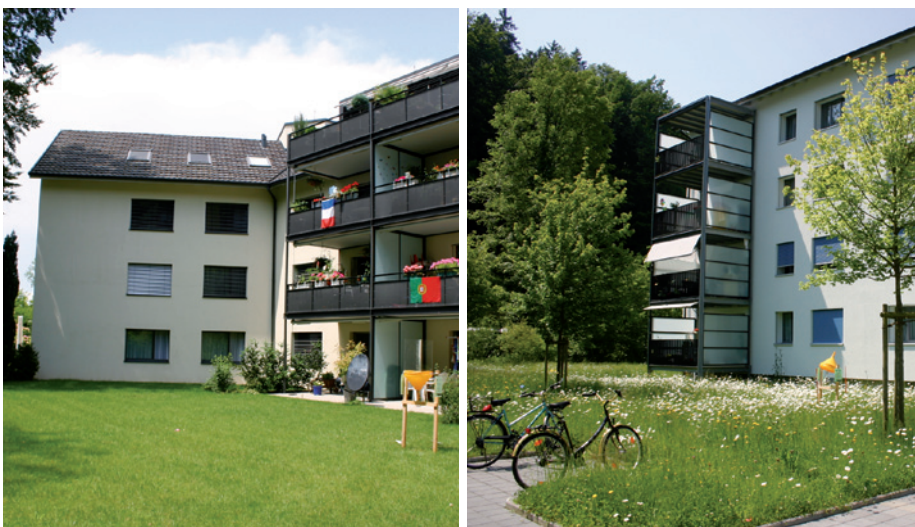
Abb. 5. Kleine Unterschiede in Gestaltung und Bewirtschaftungsintensität haben deutliche Auswirkung auf die Artenzahl: Am Standort links wurden nur 250 Insekten- und Spinnenarten gefunden, während rechts 340 verschiedene Arten lebten (SÄTTLER 2009).

reichste Pflanzengruppe. Weil einzelne invasive Neophyten einheimische Arten verdrängen können, sind sie aus natur-schützerischer Sicht eine Gefahr.